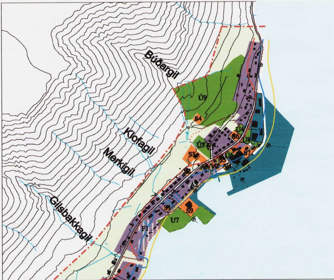
Gildandi aðalskipulag, staðfest 15.2.2006, mkv. 1 : 10 000