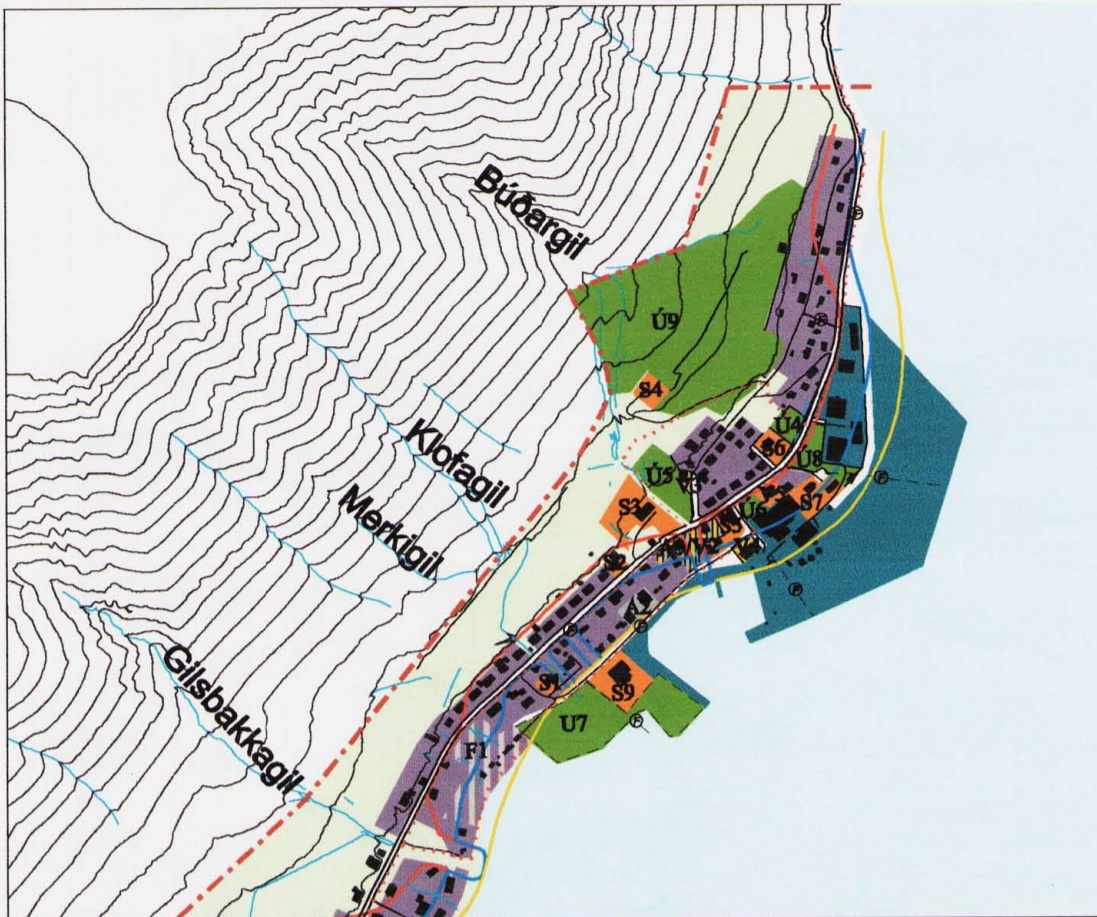
Gildandi aðalskipulag, staðfest 15.2.2006, mkv. 1 : 10 000