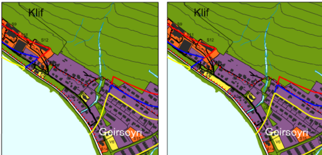
Mynd 0-2. Tillaga að breytingu/leiðréttingu fyrir svæði V4 á Patreksfirði

Gerð er breyting á svæði V4 á Patreksfirði. Svæðið er stækkað til austurs að íbúðarsvæði en fyrirhugað er að reisa sjálfsafgreiðslustöð á svæðinu ásamt bættri og stærri aðkomu fyrir Aðalstræti 62. Gæta skal við hönnun svæðisins að það falli sem best að umhverfinu undir brekkunni. Svæðið er 0,13 ha í gildandi aðalskipulagi en verður eftir stækkun 0,34 ha. Fara skal fram grenndarkynning á breytingum og stækkun á lóðinni samhliða auglýsingu á aðalskipulagsbreytingunni.